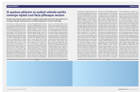
1/3 pag spread