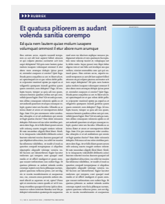
1/3 pag staand