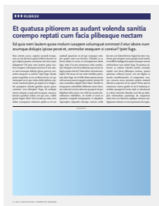
1/2 pagina liggend