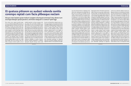
1/2 pag spread