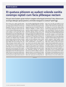
1/3 pag liggend