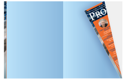
2/1 pagina uitklap cover