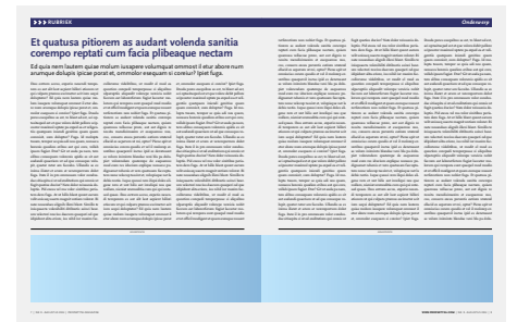
1/4 pag spread