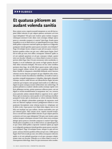
1/2 pagina staand