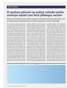
1/4 pag liggend